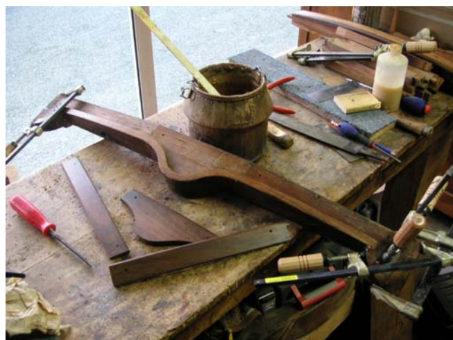
La restauration, le « pot de colle chaude »